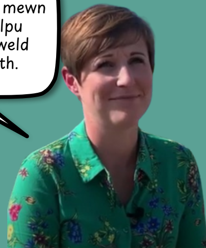
Ceri Rhiannon Gweithiwr Cymdeithasol

Cael boddhad mewn swydd o helpu rhywun a gweld gwahaniaeth.